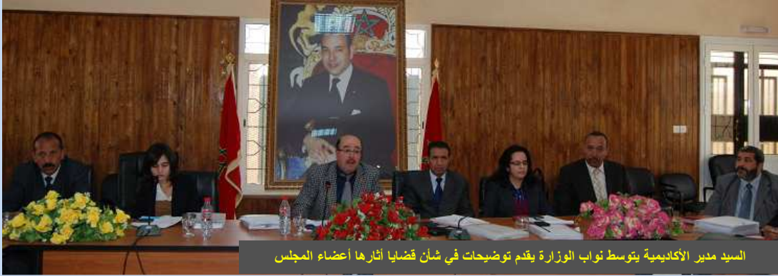
السيد مدير الأكاديمية يتوسط نواب الوزارة يقدم توضيحات في شأن قضايا أثارها أعضاء المجلس

في إطار التحضير لانعقاد الدورة الأولى للمجلس الإداري لأكاديمية جهة مكناس - تافيلالت المزمعة يوم الأربعاء 21 مارس الجاري، وتطبيقا لمقتضيات النظام الداخلي للمجلس، انعقد بقاعة الاجتماعات بالمركز التربوي الجهوي بمكناس، وعلى مرحلتين، يومي 14 و19 مارس، لقاء إعدادي للسيدات والسادة أعضاء المجلس الإداري.